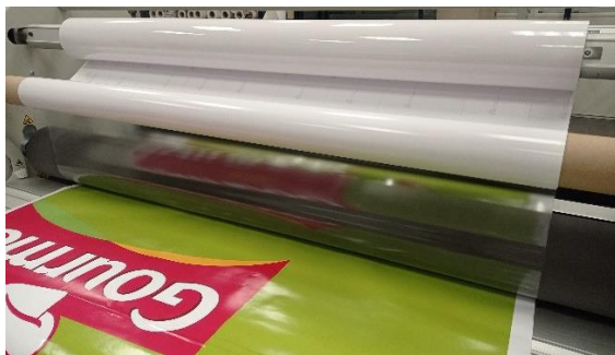
フィルムラミネート加工