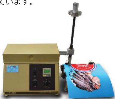
図1 耐擦過性および耐摩耗性は、テーバー式磨耗試験機を使用し、業界の標準試験方法に沿って検証しています。

HPではテーバー式磨耗試験機(図1)を使用し、業界の標準試験方法に沿って、耐擦過性および耐摩耗性を検証しています。