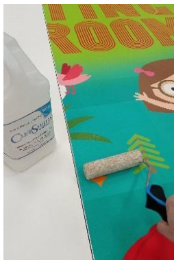
液体ラミネート加工

ラミネート加工は、出力されたグラフィックスの上に透明フィルムやクリアコートを施す仕上げ加工で、フィルムラミネート加工と液体ラミネート加工（クリアコート）の2種類が主流です。